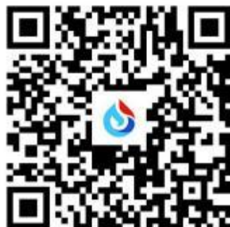
星火大模型移动web端二维码